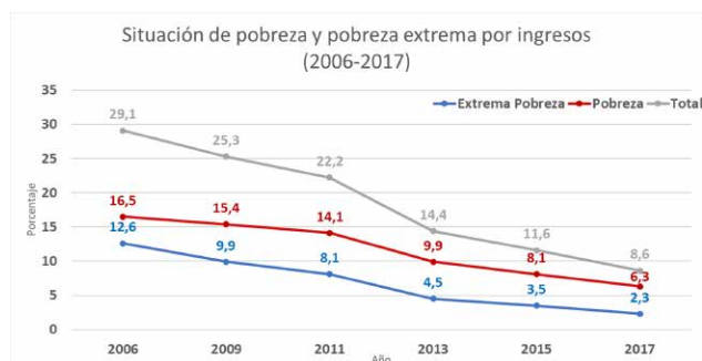
Figura 3. Población en situación de pobreza y pobreza extrema en Chile, 2006-2017

Fuente: Encuesta Casen 2017, Observatorio Social del Ministerio de Desarrollo Social y Familia.