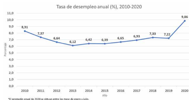
Figura 1. Tasa de desempleo anual (%) 2010-2020.

*El promedio anual de 2020 se obtuvo entre los meses de enero y julio.