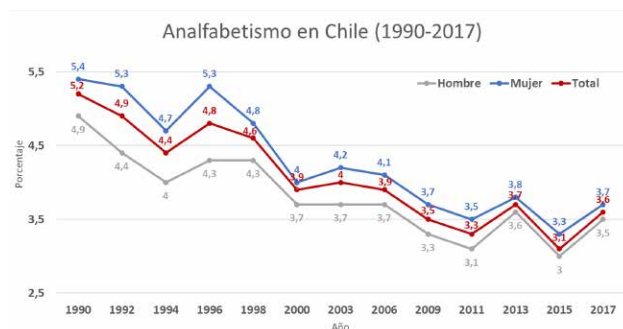
Figura 4. Población analfabeta en Chile, 1990-2017

Fuente: Encuesta Casen 2017, Observatorio Social del Ministerio de Desarrollo Social y Familia.