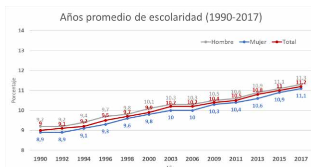
Figura 5. Años promedios de escolaridad en Chile, 1990-2017

Fuente: Encuesta Casen 2017, Observatorio Social del Ministerio de Desarrollo Social y Familia.